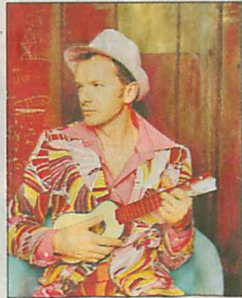
... Willy Astor

Kemmler und eventuell auch Mitglieder der Sportfreunde Stiller in den Keller steigen.