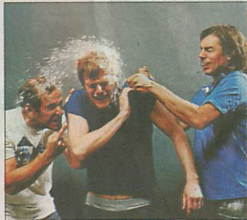
... die Sportfreunde Stiller ...